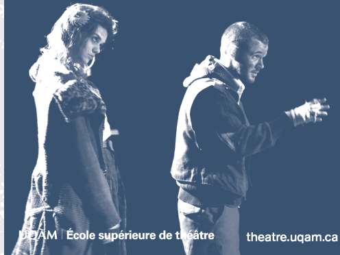
UQAM | École supérieure de théâtre theatre.uqam.ca